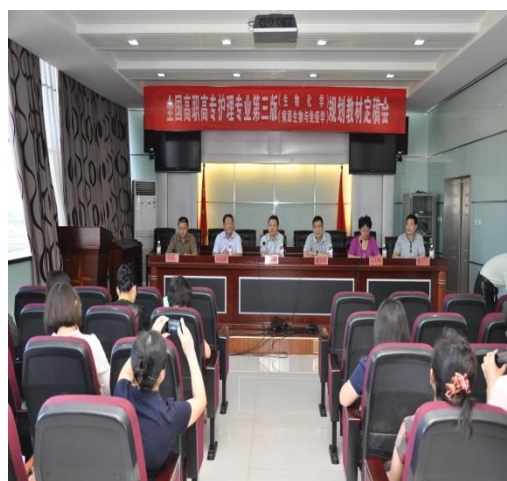
第三版《病原生物与免疫学》编写会与定稿会