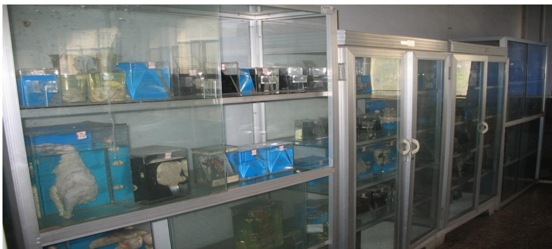
实验室陈列的寄生虫大体标本